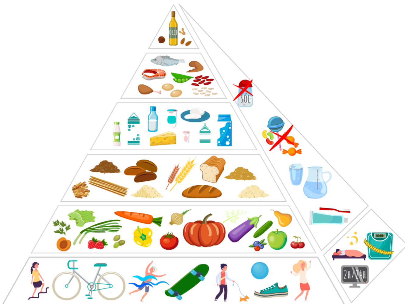
Piramida zdrowego żywienia i stylu życia dla dzieci i młodzieży. Instytut Żywności i Żywienia 2019